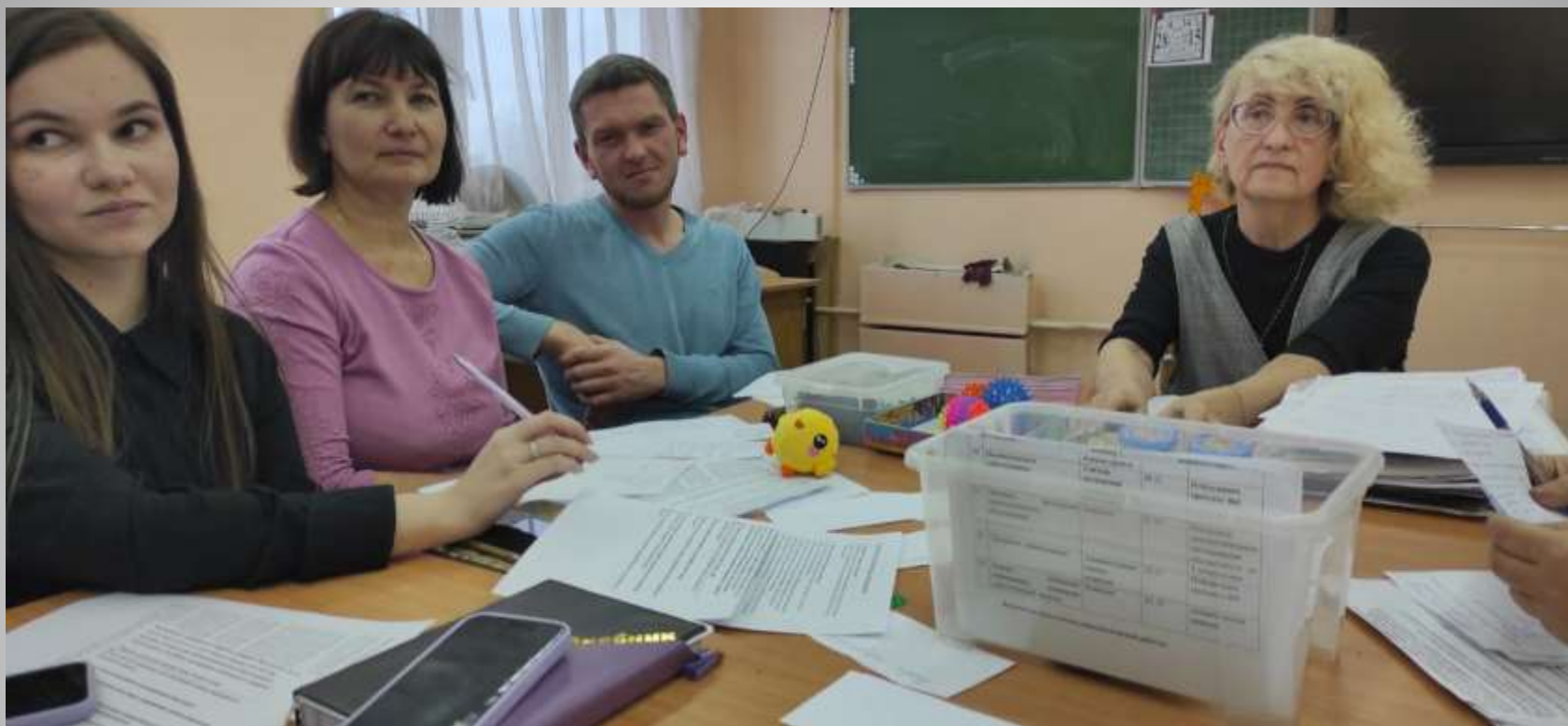
Встреча в педагогической студии «Перспектива» (январь, 2025 г.)