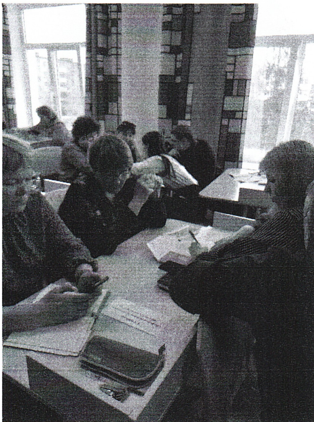
Проектная деятельность как средство повышения профессионального мастерства педагогов Гимназии. Встреча в педагогической студии «Перспектива» (май, 2026 г.)