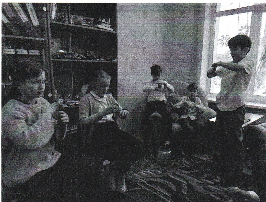
Игровая зона кабинета