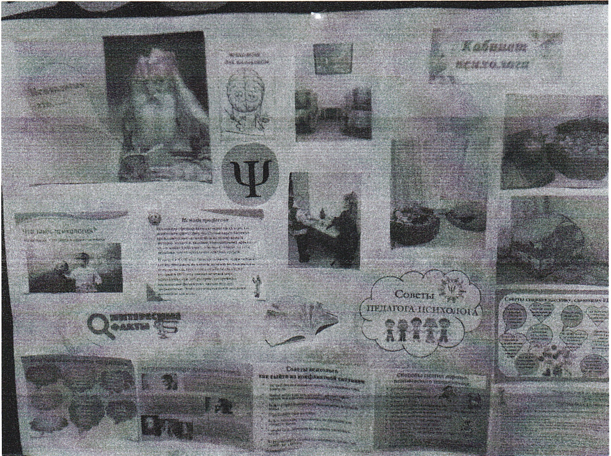
Организация образовательной среды Гимназии: оформление тематических выставок