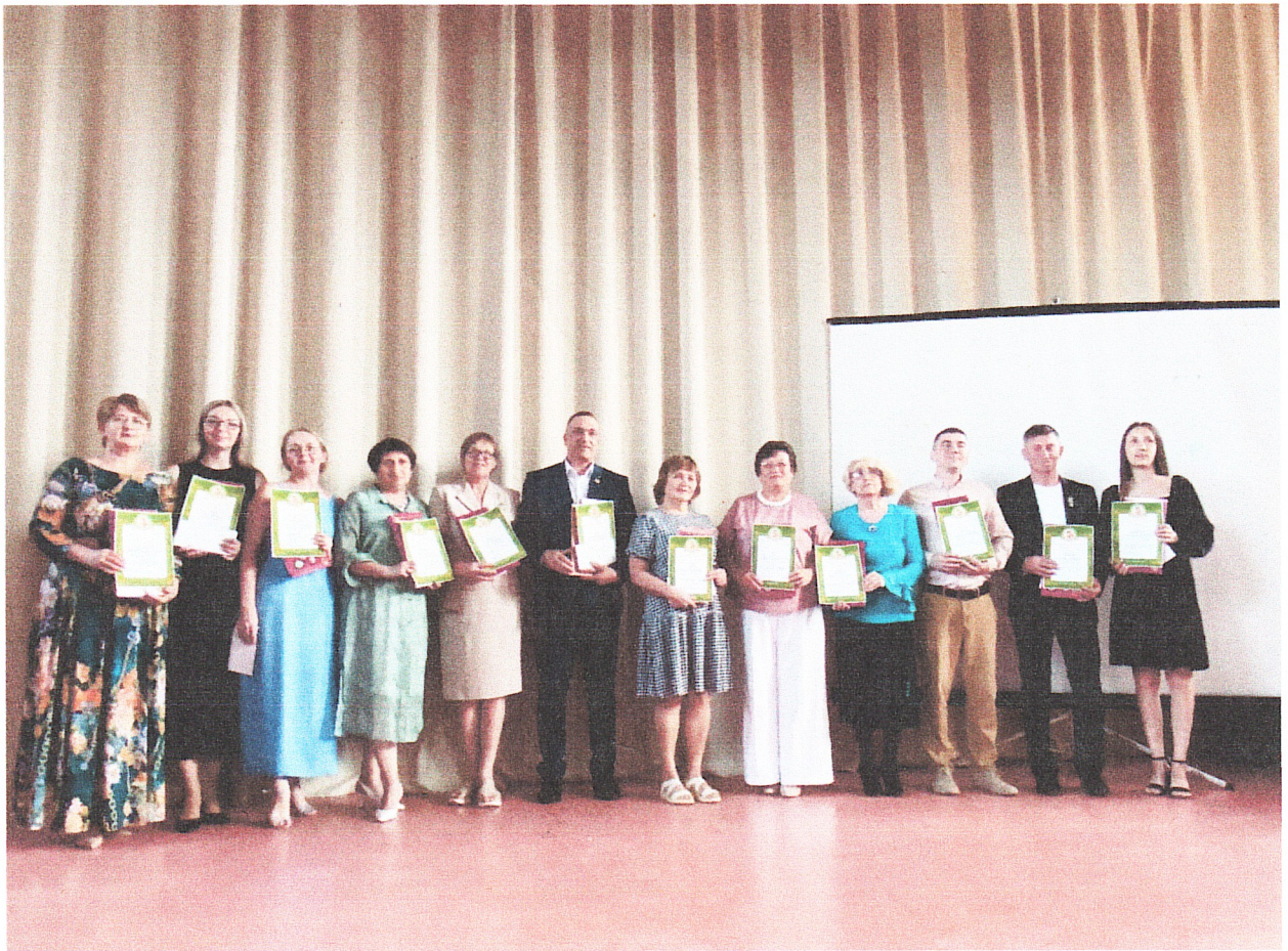
Участники и победители конкурса «ПОРТФОЛИО ПЕДАГОГА» Муниципального автономного общеобразовательного учреждения Гимназия (июнь, 2025 г.)