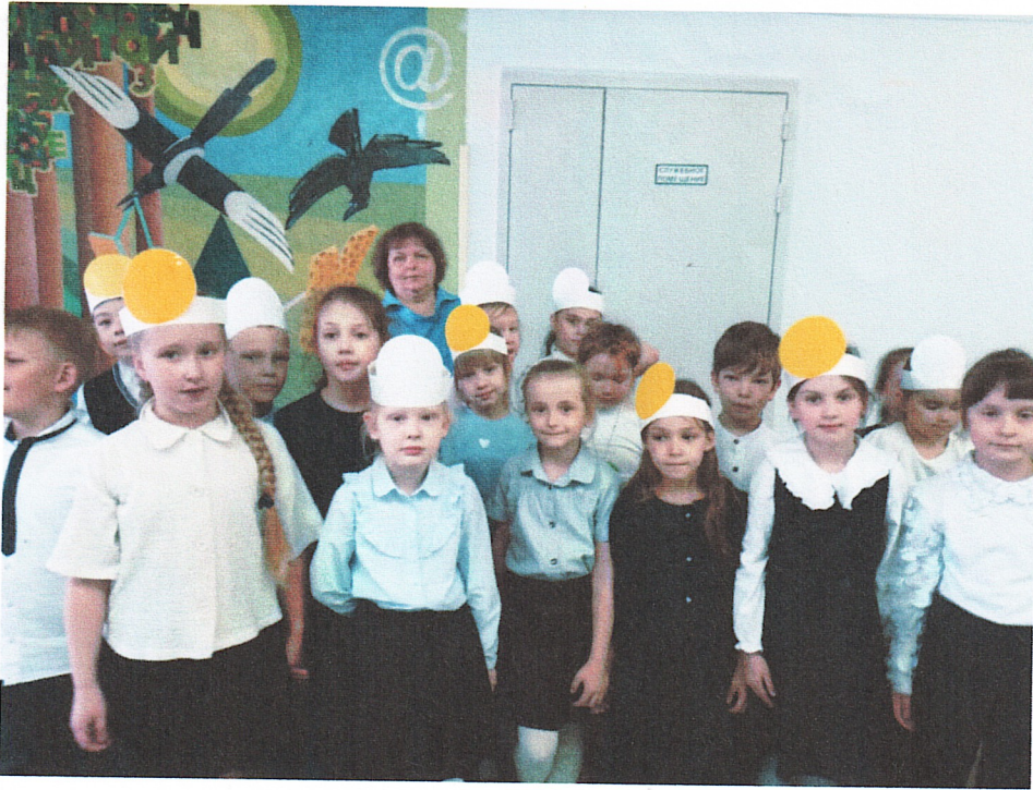
Мы – желтые и белые звезды! (1А класс)