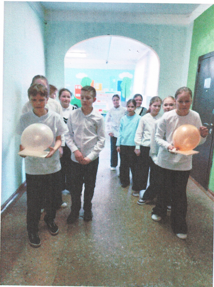
Подвижная игра «Невесомость» (4А класс)